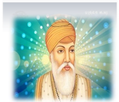
ਭਗਤ ਕਬੀਰ ਜੀ ੧੪੪੦-੧੫੧੮ ਤਕ