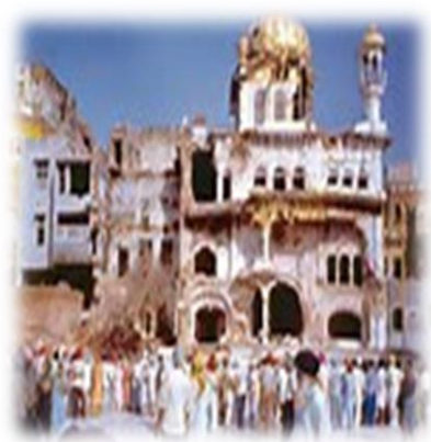
ਅਕਾਲ ਤਖਤ ੧੯੮੪ ਫੌਜੀ ਹਮਲੇ ਤੋਂ ਬਾਦ

ਜੂਨ ੨-੪ ਸ਼ੁਕਰ-ਐਤਵਾਰ (੪-੬ ਜੂਨ ੧੯੮੪ -ਤੀਜਾ ਘੱਲੂਘਾਰਾ, ਦੀ ਤੜਵੀ ਵਰੇ ਗੰਢ ) (ਆਖੰਡਪਾਠ ਆਰੰਭ ੧੦ ਵਜੇ ਸ਼ੁਕਰਵਾਰ, ਭੋਗ ਐਤਵਾਰ ੯ ਵਜੇ ਸਵੇਰੇ) (ਭਾਰਤੀ ਫੌਜ ਦੁਆਰਾ ੪ ਤੋਂ ੬ ਜੂਨ ੧੯੮੪ ਵਿਚ ਸਿੱਖਾਂ ਤੇ ਜੁਲਮ ਕਰਨਾ- ਅਕਾਲ ਤਖਤ ਸਾਹਿਬ ਢਾਹੁਣਾ-ਹਰਿਮੰਦਰ ਸਾਹਿਬ ਦੀ ਬੇਅਦਬੀ ਕਰਨੀ ਸਿੱਖ ਰੈਫਰੈਂਸ ਲਇਬਰੇਰੀ ਸਾੜਨੀ-੪੨ ਹੋਰ ਗੁਰਦੁਆਰਿਆਂ ਤੇ ਹਮਲੇ ਕਰਕੇ ਬੇਅਦਬੀ ਕਰਨੀ- ਹਜ਼ਾਰਾਂ ਦੀ ਗਿਣਤੀ ਵਿਚ ਨਿਹੱਥੇ ਸਿੱਖ ਸੰਗਤ-ਬੱਚੇ-ਔਰਤਾਂ ਦਾ ਕਤਲੇਆਮ ਕਰਨਾ- ਨਿਹੱਥੇ ਸਿੱਖਾਂ ਨੇ ਫੌਜ ਦਾ ਡੱਟ ਕੇ ਟਾਕਰਾ ਕੀਤਾ-ਸ਼ਹੀਦ ਹੋ ਗਏ ਪਰ ਹੱਥ ਖੜੇ ਨਹੀ ਕੀਤੇ