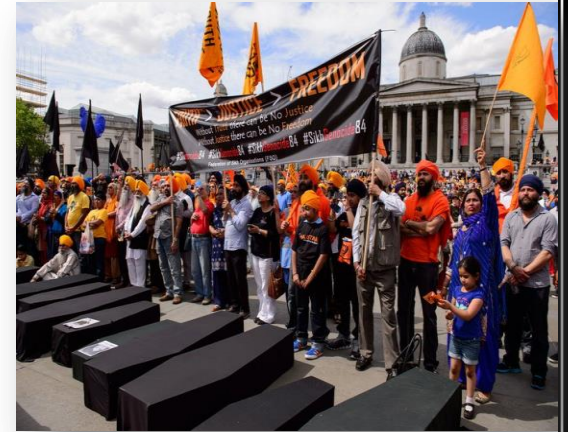
(ਸਿਖ -ਕਤਲੇਆਮ ੧੯੮੪)